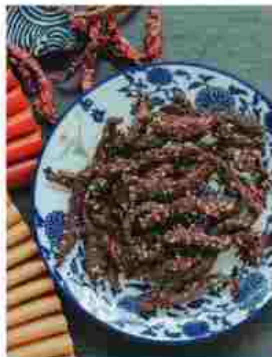
CC16 XIN JIANG BEEF JERKY 新疆风干牛肉 RM 15.70