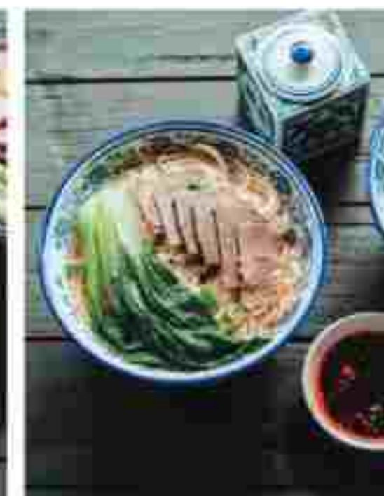
T05 MEE TARIK WITH SLICED BEEF 牛肉拉面 RM 11.90