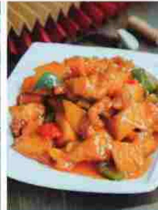
CC14 PINEAPPLE DICED CHICKEN 菠萝鸡肉 RM 19.80