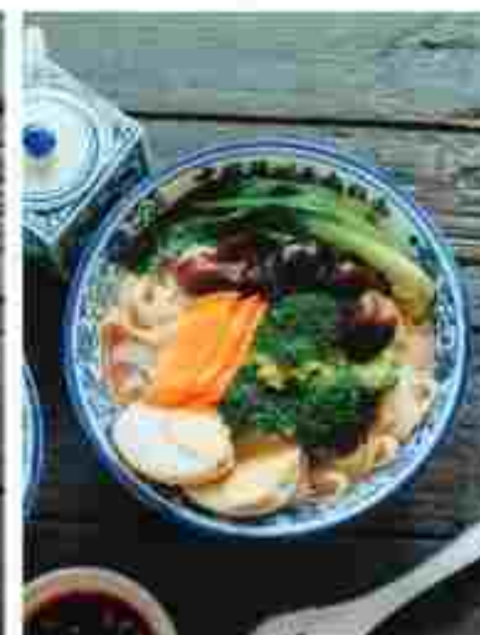
T07 MEE HIRIS WITH VEGETABLES 蔬菜刀削面 RM 7.90