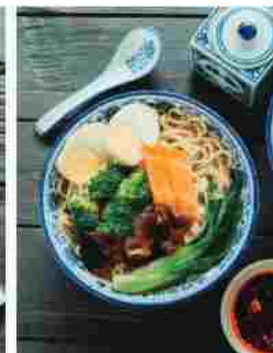
T08 MEE TARIK WITH VEGETABLES 蔬菜拉面 RM 9.80