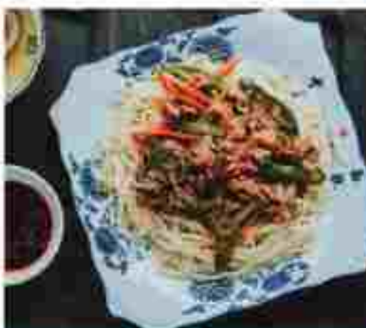
C04 🍴🍴 CUMIN LAMB NOODLES 孜然羊肉拌面 RM 15.20