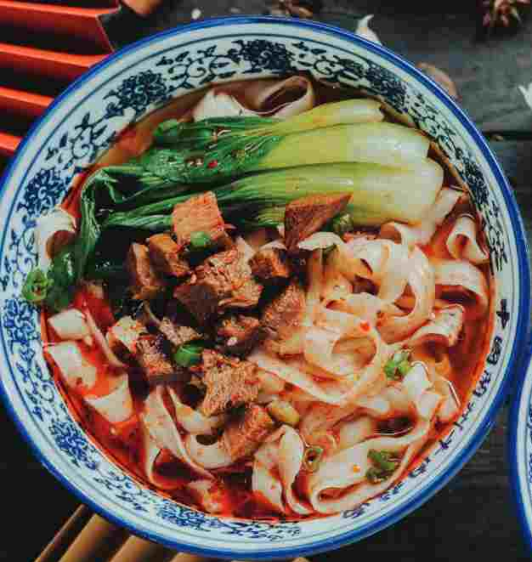
T01 MEE HIRIS SOUP WITH BRAISED BEEF 🍴🍴 招牌红烧牛肉刀削面 RM 13.30