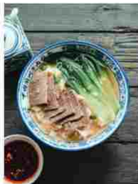
T06 MEE HIRIS WITH SLICED BEEF 牛肉刀削面 RM 11.90