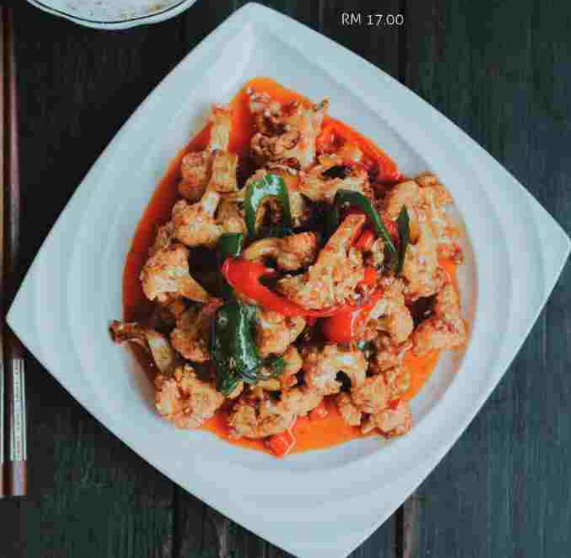
CC23 DRY POT CAULIFLOWER 干锅菜花 RM 17.00