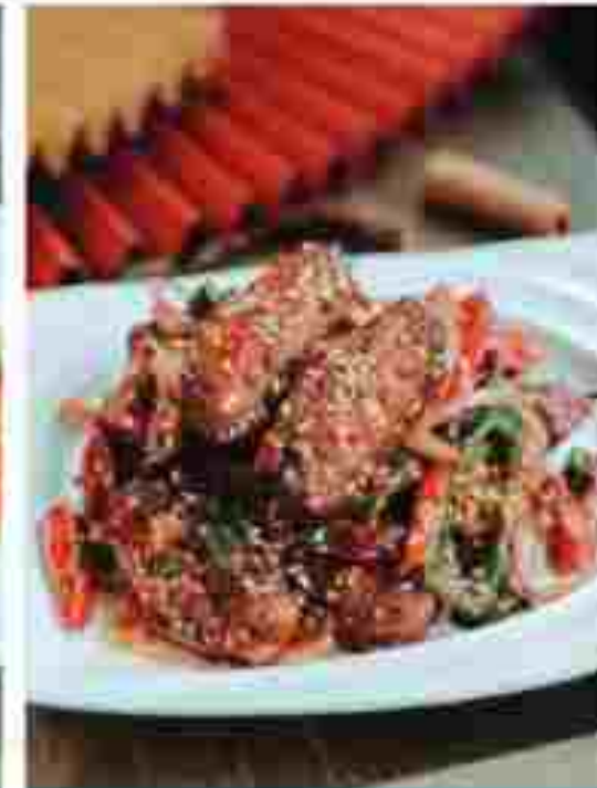
CC15 SAUTEED CHICKEN WINGS 干锅鸡翅 RM 23.80