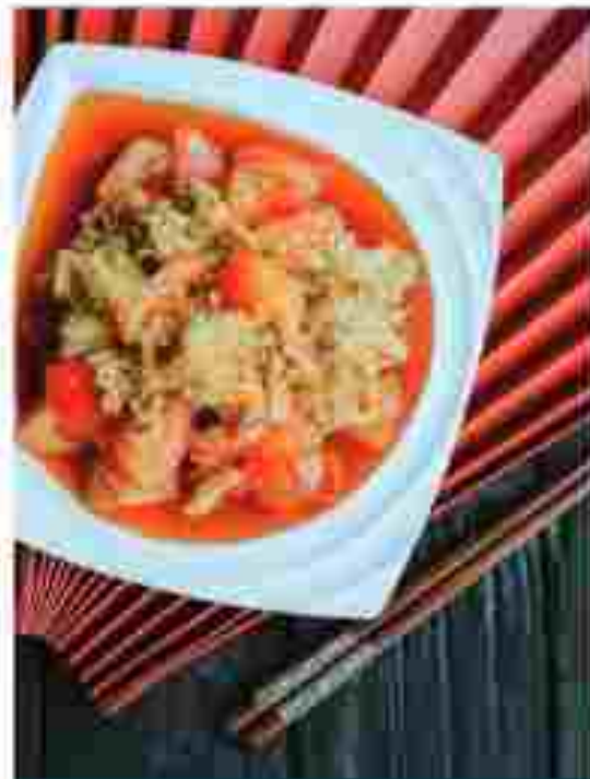
CC3 FRIED EGG WITH TOMATOES 西红柿炒蛋 RM 11.80