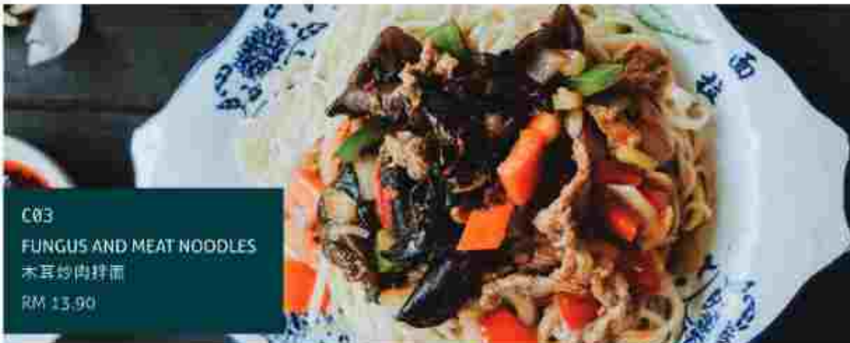
C03 FUNGUS AND MEAT NOODLES 木耳炒肉拌面 RM 13.90