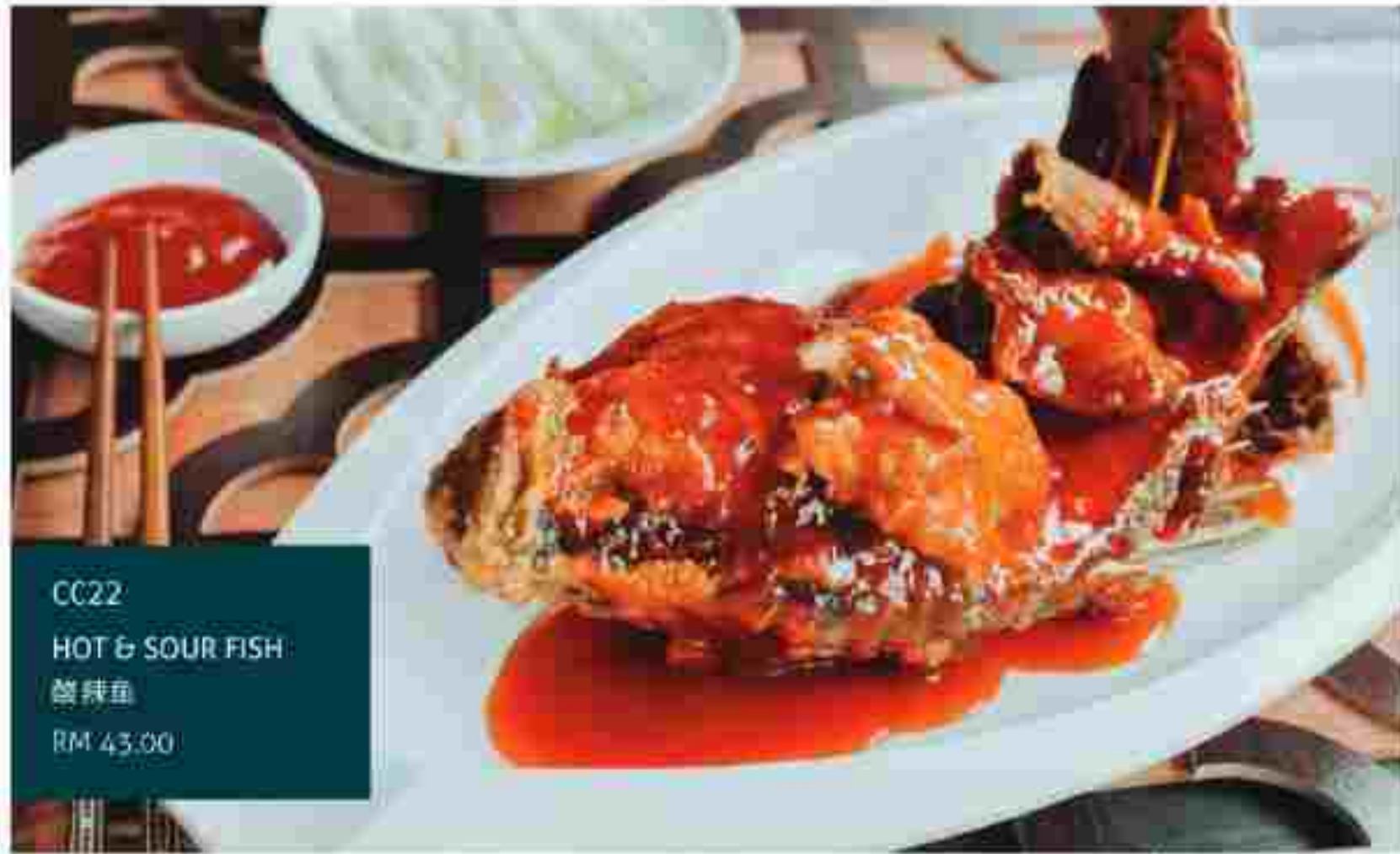
CC22 HOT & SOUR FISH 酸辣鱼 RM 43.00