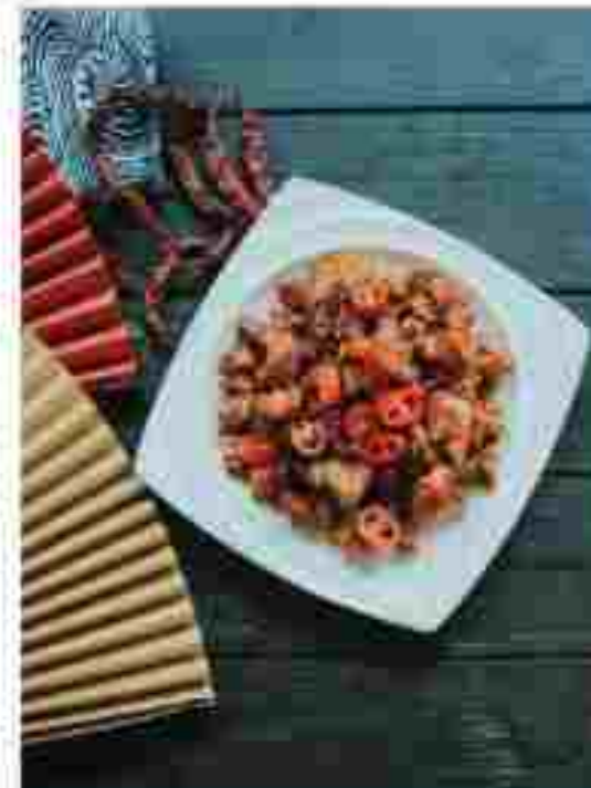
CC10 SPICY FRIED CHICKEN WITH RED CHILLI 辣子鸡 RM 29.70