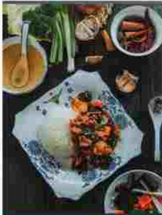
F01 FUNGUS & MEAT WITH RICE 木耳炒肉拌饭 RM 13.90