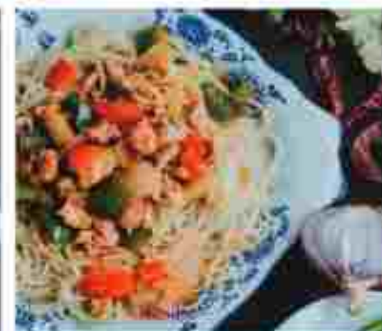
C05 🍴🍴 BRAISED CHICKEN NOODLES 红烧鸡块拌面 RM 12.90