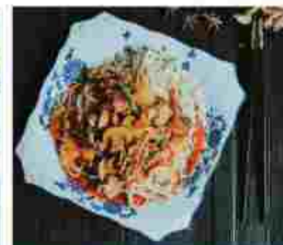
C09 BEEF & MUSHROOM NOODLES 蘑菇炒牛肉拌面 RM 13.30