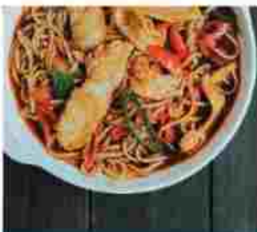
C07 🍴 XI AN POTATO VERMICELLI 西安土豆粉条 RM 13.50