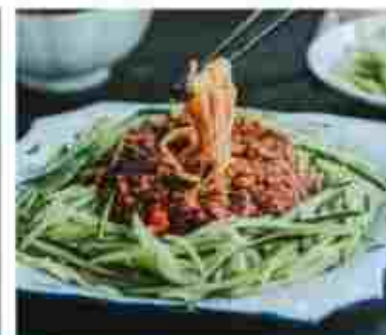
C08 NOODLES WITH SOYBEAN PASTE 炸酱面 RM 11.90