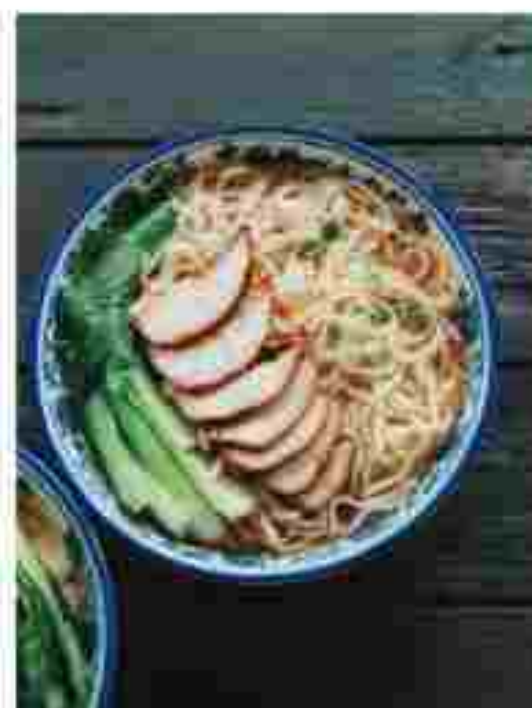
T03 MEE TARIK WITH CHICKEN 鸡扒拉面 RM 11.90