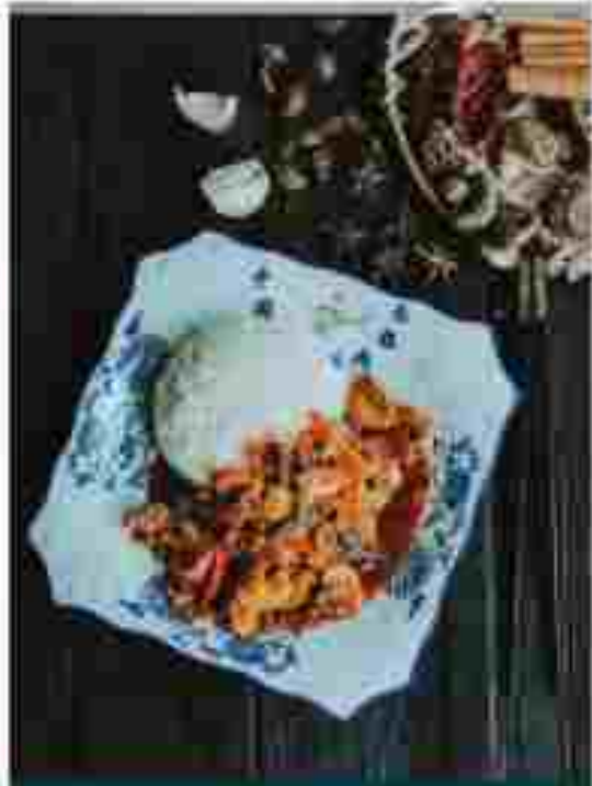
F03 BRAISED CHICKEN WITH RICE 红烧鸡块拌饭 RM 13.50