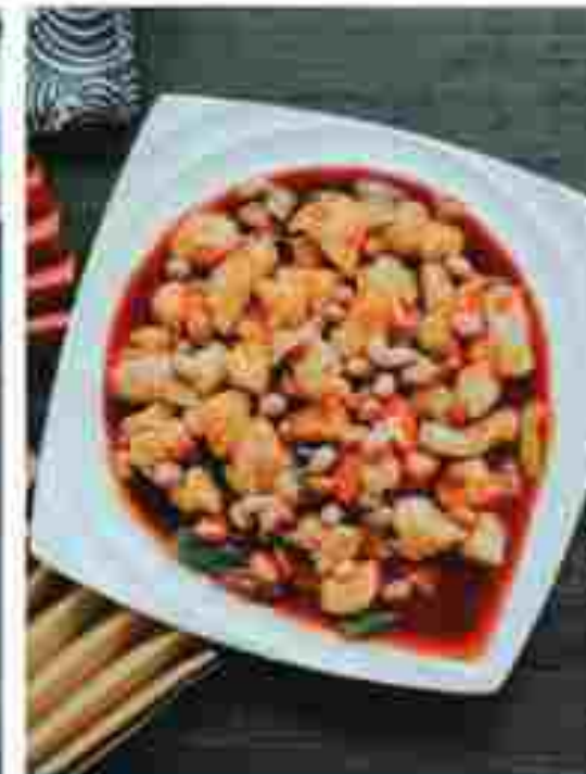
CC12 KUNG PAO CHICKEN 宫保鸡丁 RM 19.80