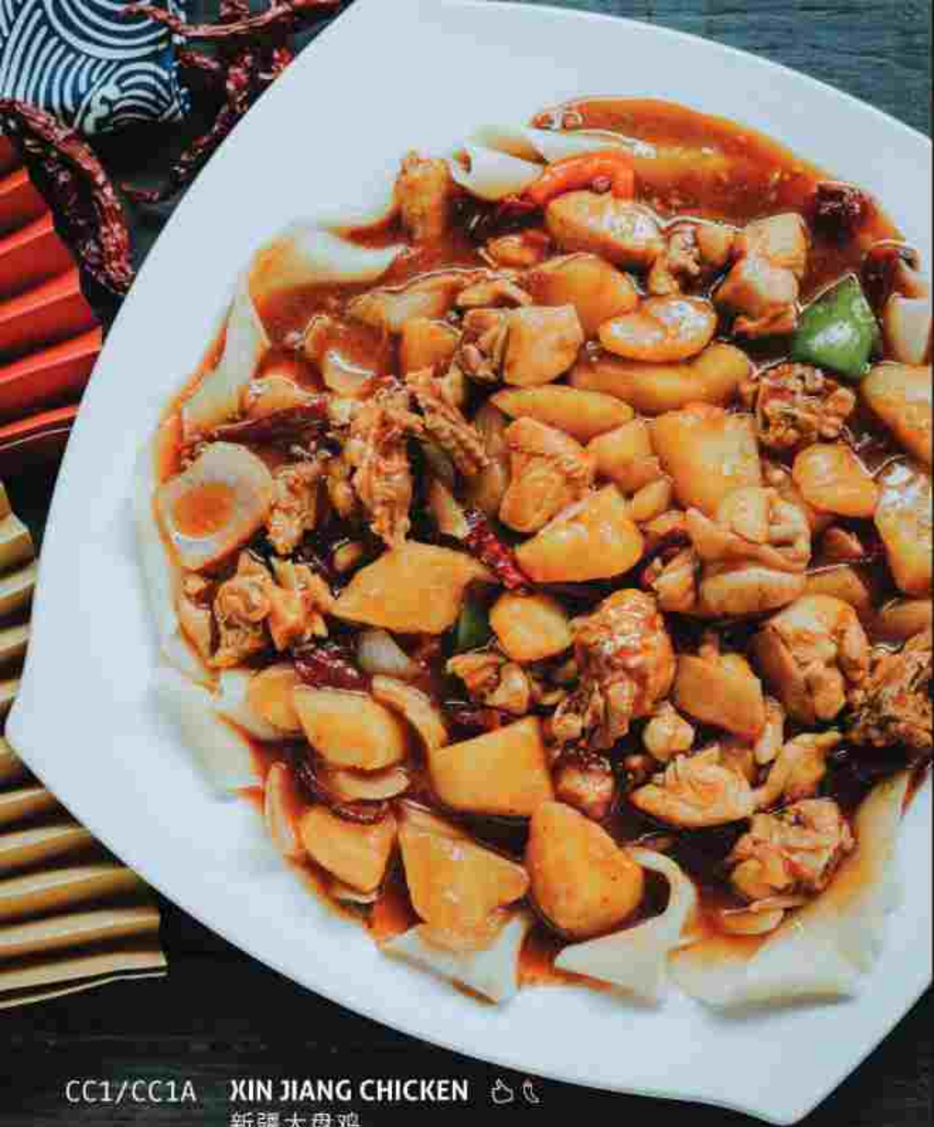
CC1/CC1A XIN JIANG CHICKEN ㇄㇄ 新疆大盘鸡