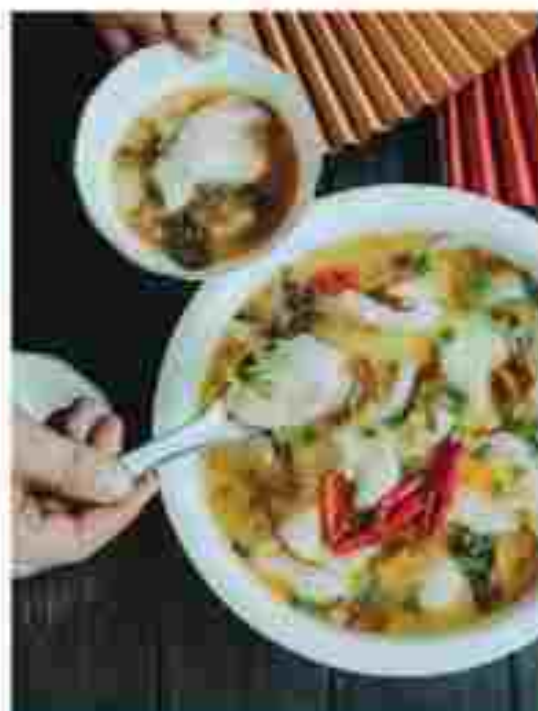
CC20 BOILED FISH WITH PICKLED CABBAGE & CHILLI 酸菜鱼汤 RM 21.50