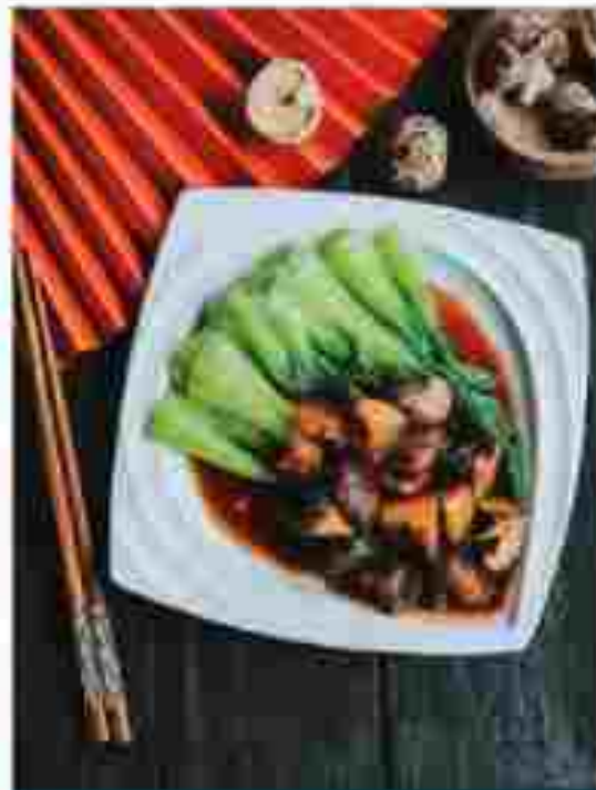
CC4 STIR-FRIED CABBAGE WITH MUSHROOM 香菇小白菜 RM 13.80