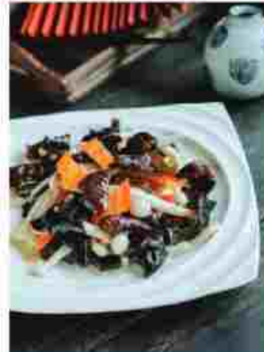
CC13 FRIED MIXED VEGETABLES 拼盘三素 RM 14.50