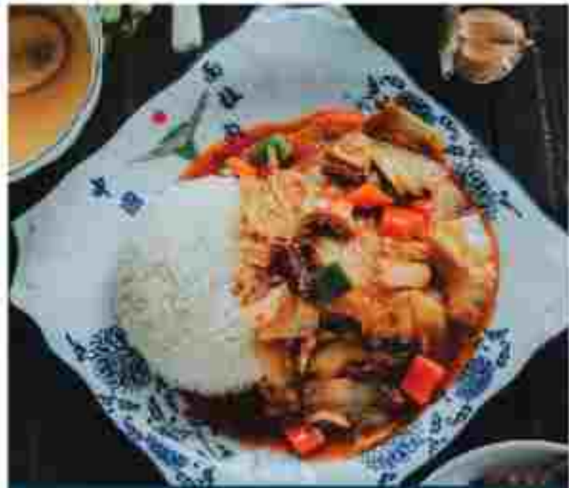
F06 KUNG PAO CHICKEN WITH RICE 宫保鸡丁拌饭 RM 13.30