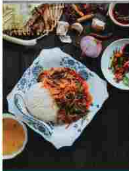
F02 占 CUMIN LAMB WITH RICE 孜然羊肉拌饭 RM 15.20