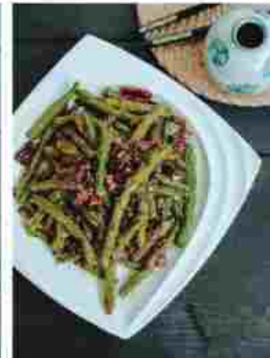
CC11 STIR-FRIED LONG BEAN 香炒长豆 RM 12.80