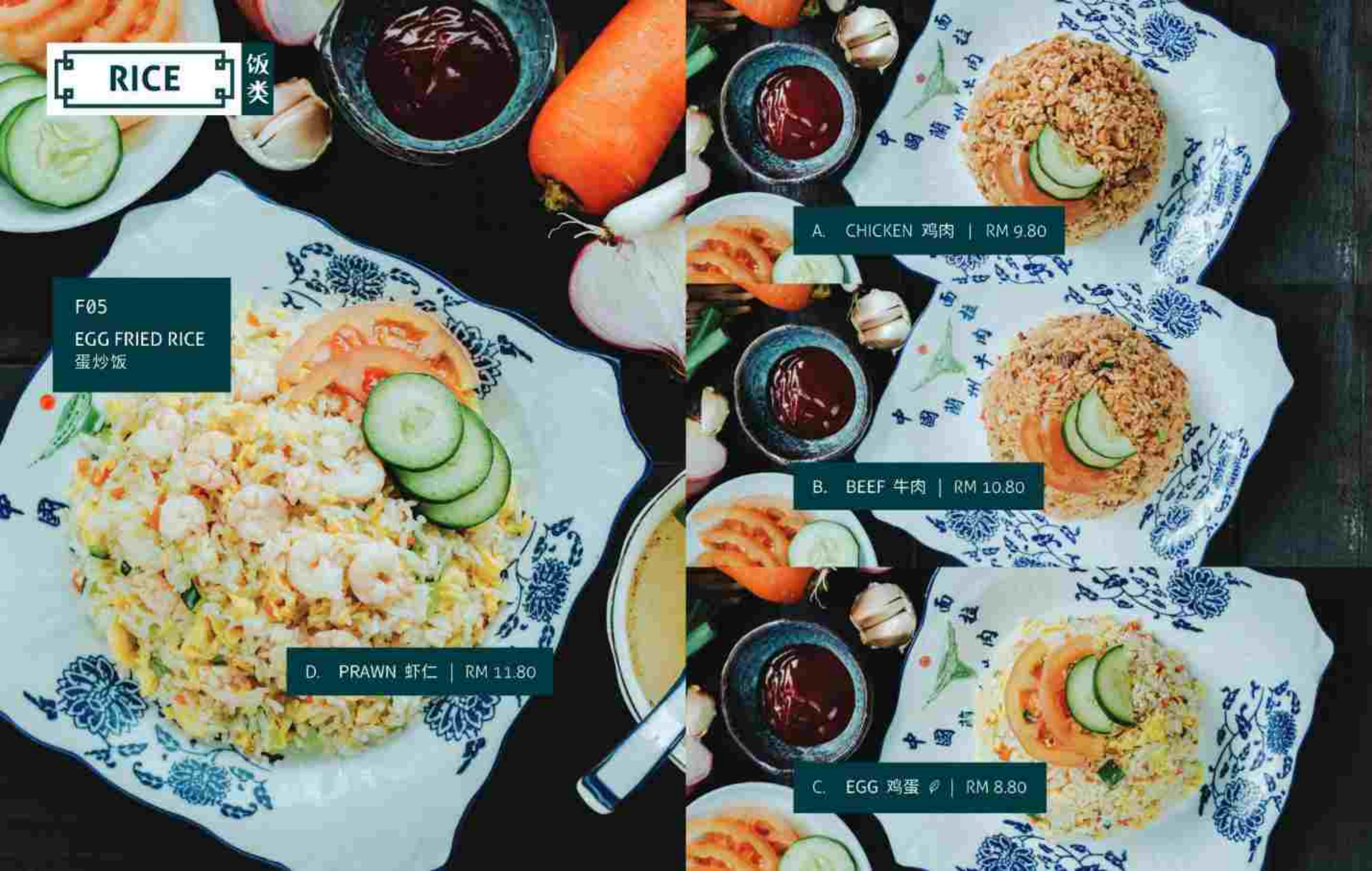
C. EGG 鸡蛋 | RM 8.80