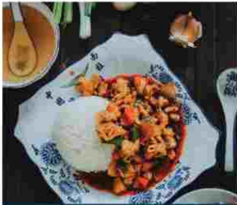
F04 占 HOT & SOUR CABBAGE WITH RICE 酸辣白菜拌饭 RM 7.90