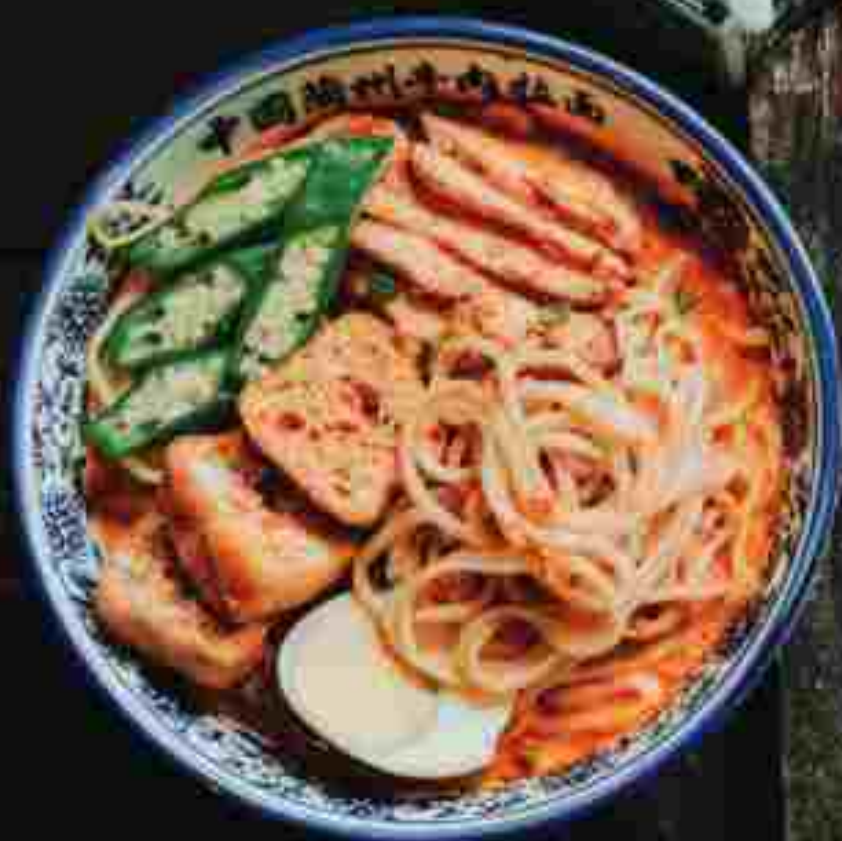
T02 BBQ CHICKEN CURRY MEE TARIK 🍴🍴 鸡肉叉烧咖喱拉面