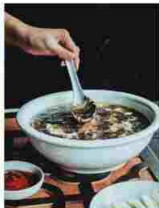
CC21 SEAWEED & EGG SOUP 紫菜蛋花汤 RM 18.00