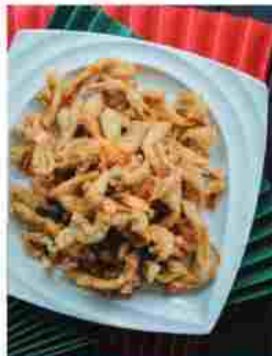
CC18 FRIED MUSHROOM 炸蘑菇 RM 18.00