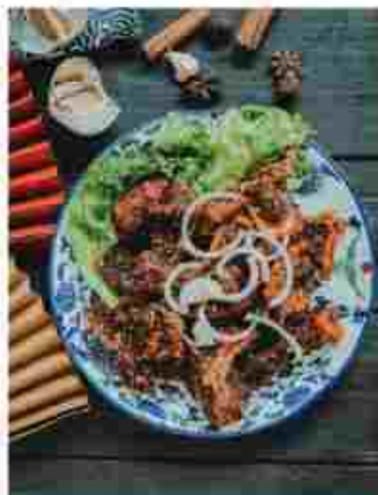
CC19 DEEP-FRIED LAMB CHOP 炸羊排 RM 28.00