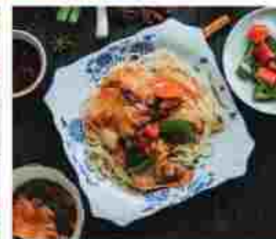
C06 🍴🍴 HOT & SOUR CABBAGE NOODLES 酸辣白菜拌面 RM 7.90