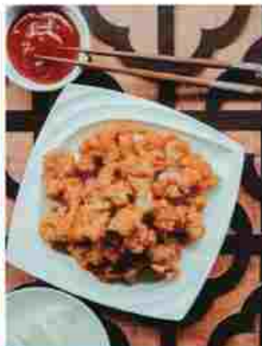
CC17 POPCORN CHICKEN 鸡米花 RM 15.70