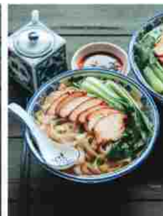
T04 MEE HIRIS WITH CHICKEN 鸡扒刀削面 RM 11.90