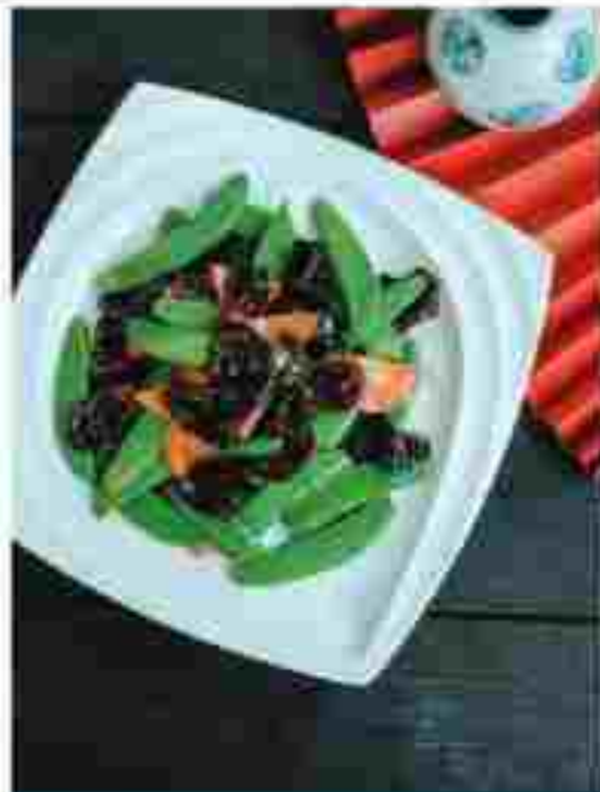
CC9 SAUTEED LENTILS WITH FUNGUS 扁豆木耳 RM 13.80